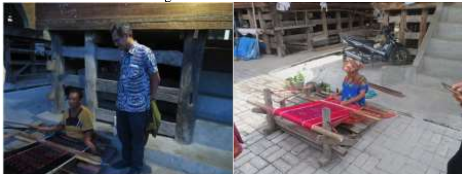
Gambar 5. Proses Pembuatan Tenun Ulos

Tahap aksi merupakan lanjutan dari tahap identifikasi, perencanaan dan pengorganisasian. Pada tahap ini dilaksanakan kegiatan penyuluhan pemasaran digital yang diikuti peserta dari kalangan pemuda dan juga orang tua, untuk memberikan cara pemasaran dengan pemanfaatan teknologi khususnya internet agar dapat menjangkau pasar yang lebih luas khususnya mancanegara, mengingat Kawasan Wisata Danau Toba dan Kampung Ulos ini sudah terkenal di mancanegara.