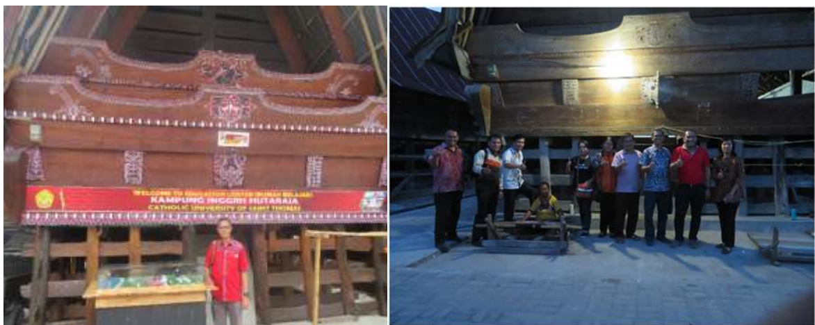
Gambar 3. Persiapan survey penyuluhan strategi pemasaran digital

Salah satu kegiatan persiapan penyuluhan strategi pemasaran ini, seperti yang terlihat dalam Gambar 3 di bawah ini.