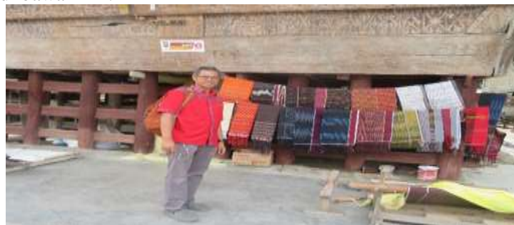
Gambar 6. Hasil kerajinan tenun ulos yang siap dipasarkan

Setelah melalui proses yang cukup panjang hasil dari pembuatan tenun ulos yang akan siap dipasarkan dapat dilihat pada gambar 6 di bawah ini :