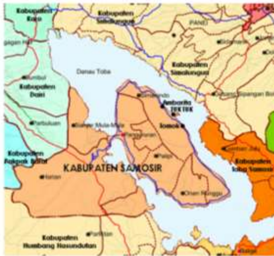
Gambar 2. Peta Kabupaten Samosir