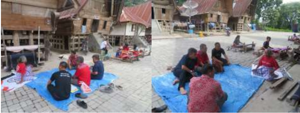
Gambar 4. Persiapan Perencanaan Kegiatan dengan Penduduk setempat

menjelaskan program yang akan dilaksanakan berupa penyuluhan pemasaran digital produk ulos kerajinan mereka guna memudahkan proses pemasaran ulos yang selama ini dilaksanakan dengan cara manual.