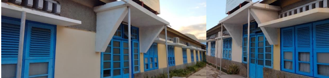
Gambar 8. Kanopi pada bagian atas pintu dan jendela pada bagian utara dan timur.

penggunaan kanopi. Fungsi utama kanopi adalah melindungi penghuni maupun bagian luar suatu bangunan dari sinar matahari ataupun terpaan hujan, namun selain fungsi tersebut kanopi juga mempunyai fungsi yang tidak kalah pentingnya, diantaranya kanopi mampu memberikan nilai dekoratif pada bangunan. Kanopi pada bangunan rumah sakit ini diletakkan dibagian atas pintu atau jendela (antara ventilasi atas dan tengah). Ukuran kanopi 50x100 centimeter terbuat dari beton, sebanyak 8 buah dan ditempatkan dibagian atas jendela sedangkan dibagian atas pintu berjumlah 1 buah dengan ukuran 100x150 centimeter.