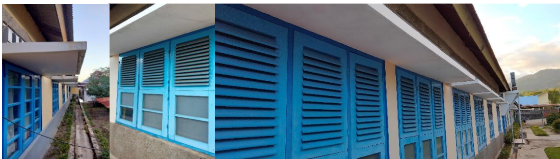
Gambar 3. Jendela ukuran 100x60 cm, pada sisi barat dan timur sebanyak 120 buah

Desain jendela pada sisi barat dan timur berupa jalusi. Jendela jalusi berfungsi untuk menahan sinar matahari tetapi masih dimungkinkan udara dari luar tetap dapat masuk ke dalam ruang. Pada sisi bagian timur dan utara terdapat bukaan-bukaan yang banyak, ini memungkinkan untuk memberikan aliran udara di sekitar lingkungan dapat masuk ke bangunan secara merata.