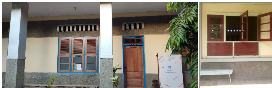
Gambar 4. Jendela ukuran 100x60 cm dan 60x40, arah barat sebanyak 20 buah dan selatan sebanyak 12 buah.