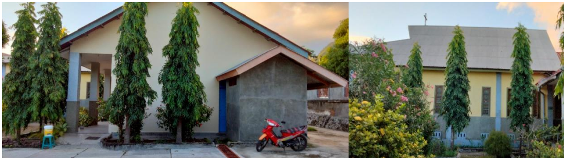
Gambar 9. Konstruksi atap yang bersudut 45° dengan tinggi 3 - 4 meter.

Bangunan dominan menggunakan konstruksi atap yang bersudut 45°. Hal ini terlihat pada bentuk atap bangunan utama maupun pada bangunan lainnya. Atap dibuat cukup lebar dan tinggi yang mencapai 3 - 4 meter, sehingga mampu mencegah air hujan untuk masuk kedalam bangunan. Atap yang tinggi dan lebar dapat mengalirkan air hujan dengan mudah kebawah sehingga dapat terhindar dari genangan air pada atap atau kanopi yang berbentuk datar. Selain itu, atap yang tinggi memiliki volume ruang antara penutup atap dan langit-langit cukup besar, ini dapat membantu mengurangi pemanasan ruang-ruang dalam bangunan sehingga ruangan semakin dingin.