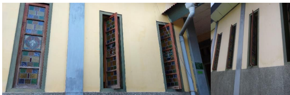
Gambar 5. Jendela ukuran 120x60, arah selatan sebanyak 12 buah.

Ventilasi Atas (lubang angin atas) pada bangunan ini mempunyai ukuran yang relatif tidak besar yaitu 15x15 cm, jumlahnya cukup banyak dan diletakkan disetiap sisi (timur, barat, utara dan selatan)