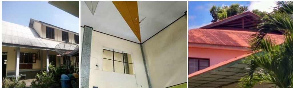
Gambar 6. Ventilasi atas barat dan timur ukuran 150x200 cm dan 50x50 cm

Ventilasi atap dapat juga berfungsi untuk mengeluarkan udara panas yang terperangkap di bawah penutup atap (karena radiasi matahari) sehingga mudah dibuang dan mengalir keluar, agar panas tersebut tidak merambat ke langit-langit. Ruangan yang memiliki ventilasi atap adalah ruangan karyawan, dapur dan gudang dimana ruangan ini digunakan untuk tempat kerja dan tidur karyawan, ruang penyimpanan peralatan dan makanan. Ruangan ini memiliki jendela untuk sirkulasi udara dibawah atap, sehingga terkesan terlihat dari arah luar seperti bangunan bertingkat. Di bagian belakang terdapat cerobong asap. Cerobong asap diletakan diatas atap bangunan, tepatnya di bawah ruangan dapur. Fungsi cerobong asap ini agar sirkulasi udara kotor dari dapur (asap) dapat keluar dengan mudah dan terjadi pertukaran udara dari luar sangat baik sehingga asap yang dihasilkan di dapur tidak dapat masuk ke ruangan lain yang berada di sekitarnya.