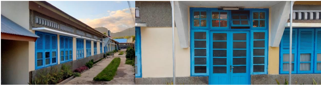
Gambar 2. Tampak Depan Rumah Sakit Keluarga Kudus Ende

Desain jendela pada sisi barat dan timur berupa jalusi. Jendela jalusi berfungsi untuk menahan sinar matahari tetapi masih dimungkinkan udara dari luar tetap dapat masuk ke dalam ruang. Pada sisi bagian timur dan utara terdapat bukaan-bukaan yang banyak, ini memungkinkan untuk memberikan aliran udara di sekitar lingkungan dapat masuk ke bangunan secara merata.