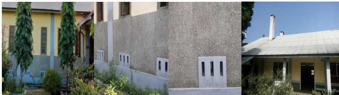
Gambar 7. Ventilasi bawah, arah selatan ukuran 30x15 cm, sebanyak 12 buah dan 2 buah cerobong asap.

Ventilasi atas diletakkan menghadap kearah timur, barat, selatan, dan utara. Kearah selatan dan utara sebanyak 20 buah, dengan ukuran 15x30 cm. Tipe dari jalusi/ krepyak, jendela jalusi/ krepyak salah satu alternatif agar udara segar selalu masuk kedalam ruangan selama 24 jam. Dan ventilasi bawah diletakkan menghadap kearah utara sebanyak 16 buah, tipe ventilasi boven dengan ukuran 30x30 cm. Serta terdapat ventilasi atap pada bangunan ini yang diletakkan pada arah barat dan timur dengan ukuran 150x200 cm.