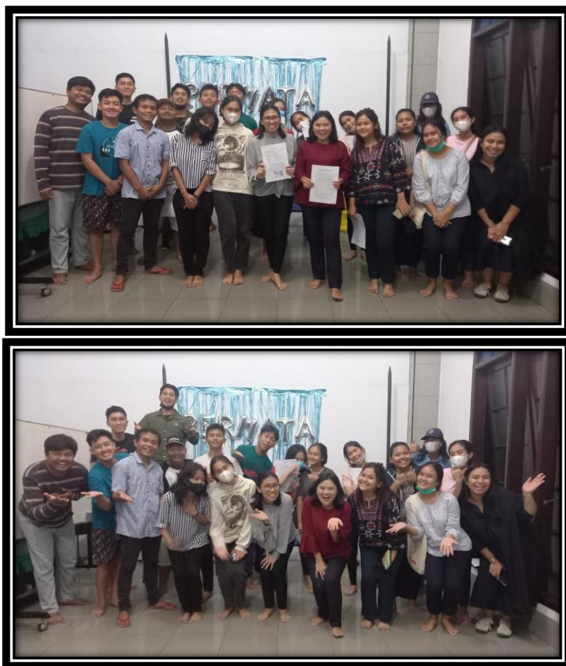
Gambar 3. Foto Bersama Pemateri dengan Peserta Penyuluhan