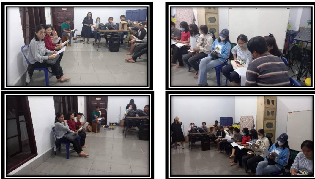
Gambar 2. Pemberian Materi Penyuluhan