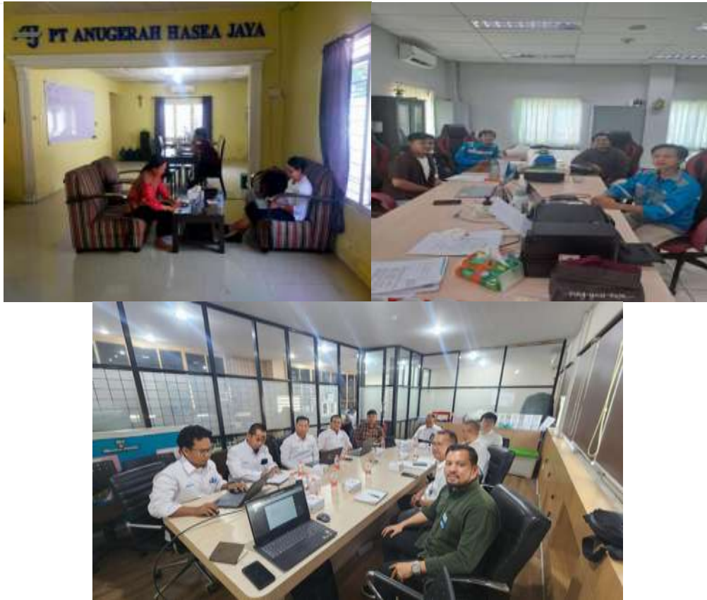
Gambar 2. Kegiatan Pengabdian