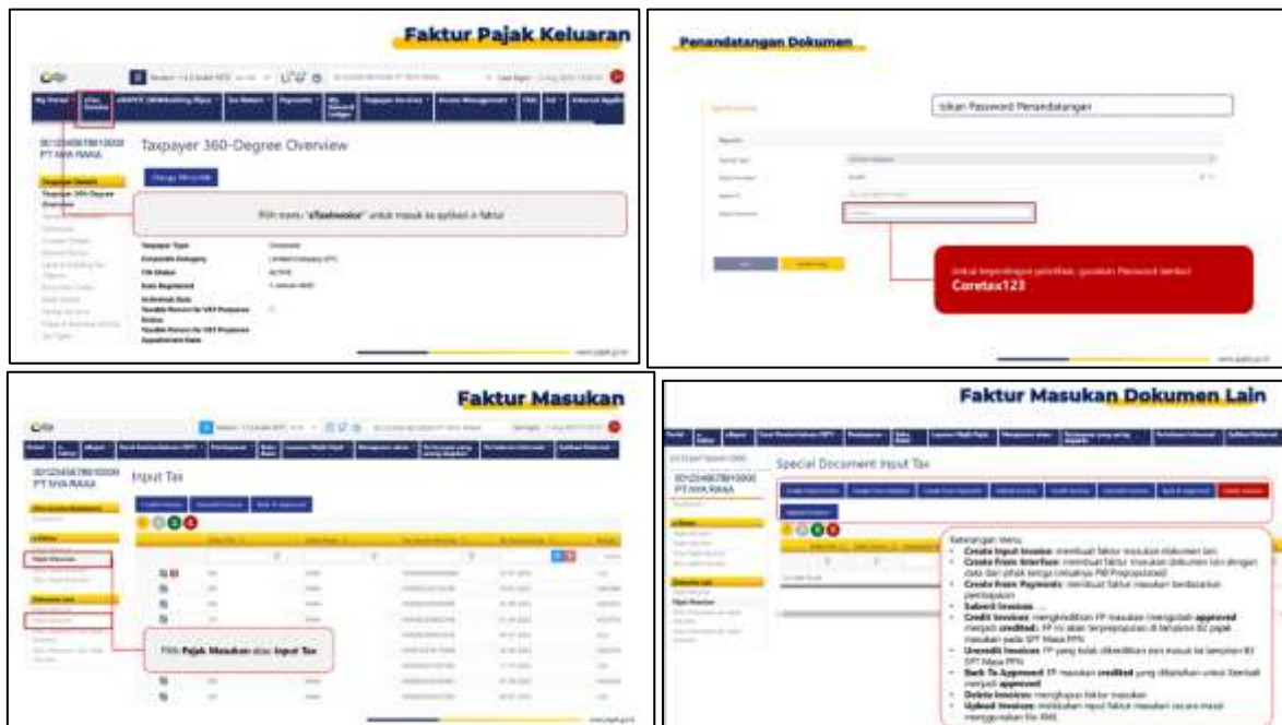
Gambar 3. Faktor Pajak Keluaran dan Pengelolaan Faktor Pajak Masukan dengan Coretax