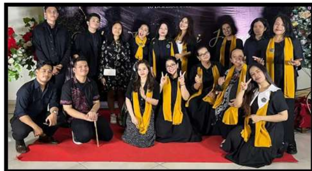
Gambar 2. Dokumentasi Pelaksanaan Kegiatan