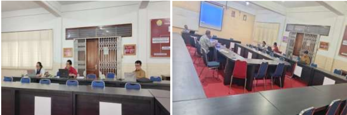
Gambar 2. Kegiatan Pengabdian