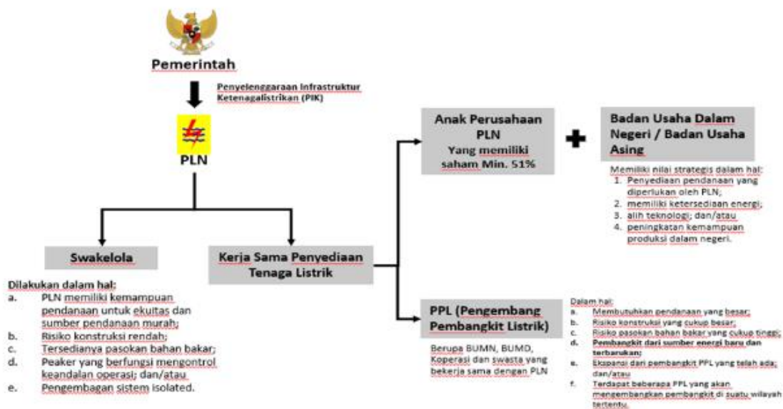
Gambar 1. Skema Joint venture Berdasarkan Peraturan Presiden Nomor 4 Tahun 2016 jo. Peraturan Presiden Nomor 14 Tahun 2017

Dibawah ini adalah Skema joint venture berdasarkan Peraturan Presiden Nomor 4 Tahun 2016 jo. Peraturan Presiden Nomor 14 Tahun 2017: