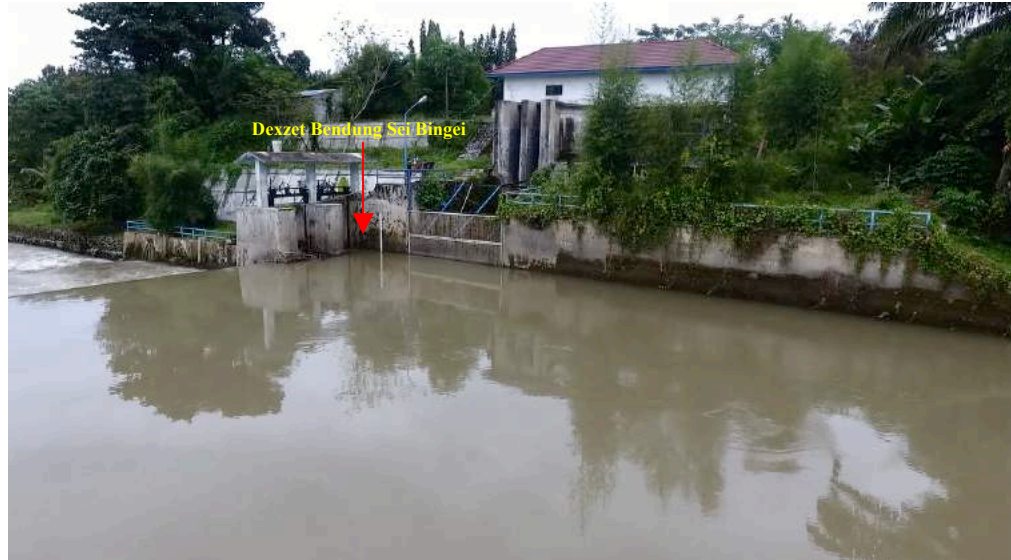
Gambar 1. Titik Referensi