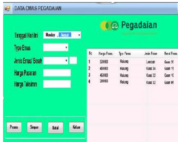
Gambar 5. Proses Harga Emas Pasaran