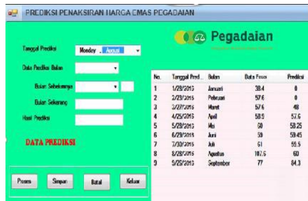
Gambar 7. Proses Penaksiran harga emas