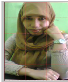
Gambar 1 Gambar Sampel ukuran

Penelitian ini menggunakan gambar sampel dengan ukuran 3 x 5 dan berjenis gambar berwarna yang merupakan hasil pengecilan dari gambar berukuran 1200 x 1800 dan berjenis gambar berwarna. Hal ini dilakukan untuk mempersingkat proses perhitungan manual yang dituangkan dalam penelitian ini. Namun, pada proses pengujian sistem dapat digunakan gambar yang berukuran lebih besar.