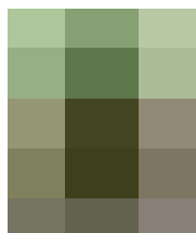
Gambar 2 Citra Plain ukuran 3x5