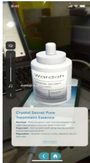
Gambar 5b. Hasil AR Pure Treatment Essence

Gambar 5a merupakan tampilan hasilAR untuk Bright Activting beserta manfaat, kegunaan dan jadwal penggunaan. dan gambar 5b merupakan tampilan AR untuk Pure Treatment Essence beserta manfaat, kegunaan dan jadwal penggunaan.