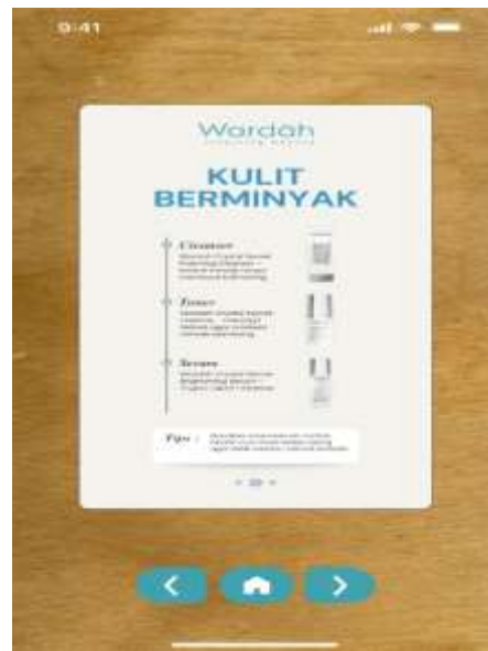
Gambar 6b. Hasil AR markerless kulit berminyak

Gambar 6a merupakan tampilan hasil AR markerless untuk kulit kering beserta rekomendasi skincare yang digunakan untuk kulit kering. dan gambar 6b merupakan tampilan hasil AR markerless untuk kulit berminyak beserta rekomendasi skincare yang digunakan untuk kulit berminyak.