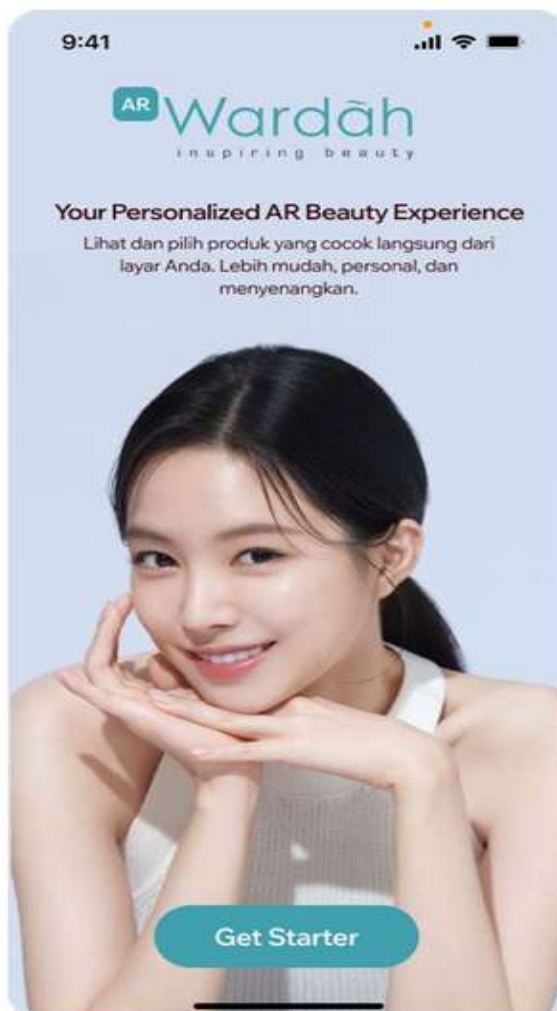
Gambar 2a. Tampilan Awal Aplikasi