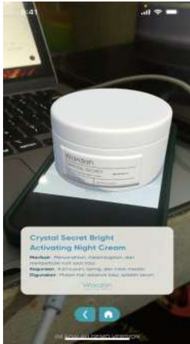
Gambar 5a. Hasil AR dengan Bright Activting