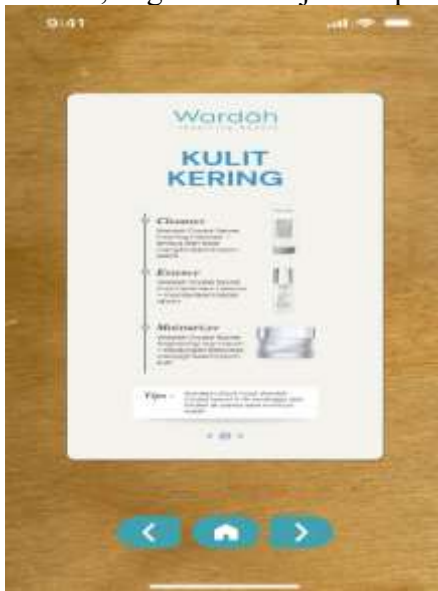
Gambar 6a. Hasil AR markerless kulit kering

Gambar 5a merupakan tampilan hasilAR untuk Bright Activting beserta manfaat, kegunaan dan jadwal penggunaan. dan gambar 5b merupakan tampilan AR untuk Pure Treatment Essence beserta manfaat, kegunaan dan jadwal penggunaan.