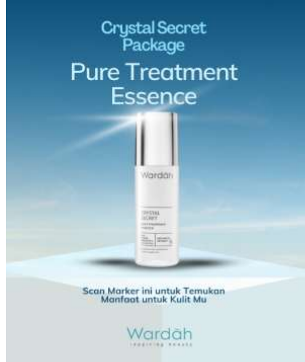
Gambar 4b. Marker Pure Treatment Essence

Gambar 4a merupakan tampilan Marker Bright Activting yang digunakan sebagai marker untuk menampilkan hasil gambar Bright Activting aplikasi AR. dan gambar 4b merupakan tampilan Marker Pure Treatment Essence yang digunakan sebagai marker untuk menampilkan hasil gambar Pure