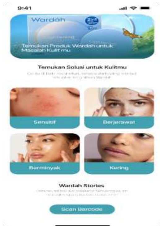
Gambar 3a. Tampilan Temukan solusi untuk kulit