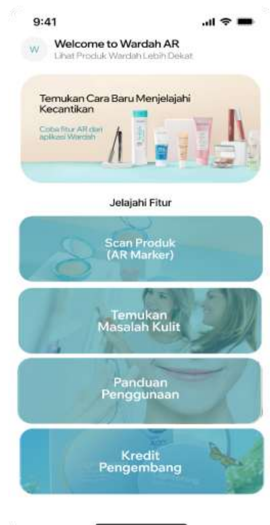
Gambar 2b. Tampilan Welcome to Wardah AR

Gambar 2a merupakan tampilan utama dari AR ( Augmented Reality ) terkait fungsi " Get starting " mengacu pada antarmuka awal yang pengguna pilih ketika memulai aplikasi. Gambar 2b merupakan tampilan awal setelah klik get starting pada aplikasi berisi menu yang dapat dipilih oleh user yaitu menu Scan produk, temukan masalah kulit, panduan penggunaan dan kredit pengembang.