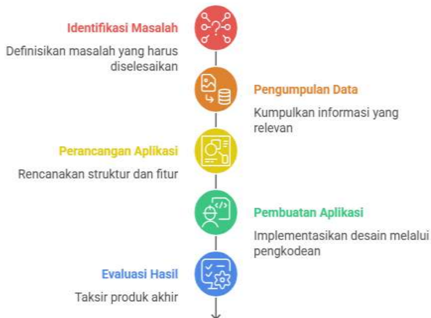
Gambar 1. Tahapan Penelitian

Desain penelitian merupakan suatu rancangan menyeluruh yang disusun untuk mengintegrasikan berbagai komponen studi secara logis dan sistematis. Desain ini berfungsi sebagai pedoman dalam proses pengumpulan, pengukuran, serta analisis data. Dengan adanya desain penelitian, seluruh tahapan penelitian dapat dilaksanakan secara terarah dan konsisten [22],[23]. Adapun proses penelitian yang akan dilakukan dalam studi ini dapat digambarkan melalui langkah-langkah sebagai berikut.