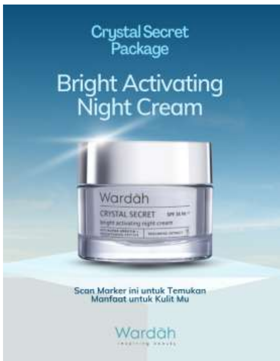
Gambar 4a. Marker Bright Activting

Gambar 3a merupakan tampilan panduan penggunaan untuk mengetahui bagaimana panduan menjalankan aplikasi AR. dan gambar 3b merupakan tampilan temukan solusi untuk kulitmu pada aplikasi wardah AR untuk mengetahui jenis kulit dan rekomendasi skincare yang cocok digunakan.