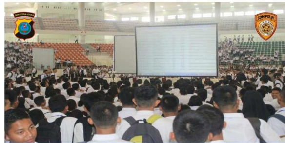
Gambar 8. Proses validasi ekstraksi LJK dihadapan semua Peserta ujian Akademik

Setelah proses scanner Lembar Jawaban Komputer (LJK) selesai, maka berikutnya adalah tahapan untuk koreksi dimana pada saat mengoreksi, semua LJK hasil scanner tadi di ekstraksi menggunakan aplikasi OMR untuk merubah gambar (image) kedalam bentuk abjad, setelah semua LJK selesai diekstraksi kemudian dilakukan proses validasi untuk mengecek apakah semua lembar jawaban komputer dapat dibaca dengan baik oleh OMR, khususnya validasi untuk nomor peserta, nama peserta harus disesuaikan dengan data induk peserta ujian.