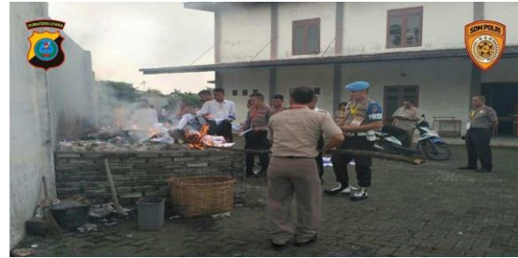
Gambar 12. Pemusnahan Berkas dan Soal Ujian dihadapan pengawas dan peserta ujian

itu melalui panitia dan disaksikan oleh pengawas internal dan eksternal semua soal tersebut dibakar/musnahkan.