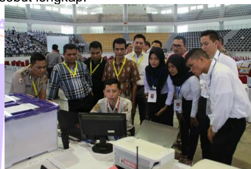
Gambar 5. Pencetakan Soal Ujian Akademik dihadapan Panitia, Pengawas dan perwakilan Peserta

daerah. Sebelum password diberikan oleh panitia pusat maka oleh panitia daerah diberikan kesempatan untuk memasukkan sembarang password untuk membuka soal tersebut kepada peserta ujian sampai peserta tersebut menyerah untuk menjamin keamanan soal tersebut. Kemudian perwakilan peserta ujian tadi memasukkan password yang sudah diberikan dari mabes polri untuk membuka soal ujian dan perwakilan peserta tetap berada di lokasi untuk ikut menyaksikan pembukaan soal sampai pencetakan master soal ujian yang juga dibuka secara transparansi ditampilkan menggunakan layar monitor dan LCD Proyektor, yang didampingi oleh Auditor IT, pengawas eksternal, pengawas internal Irwasda dan Paminal. Setelah master soal dicetak, kemudian oleh panitia, pengawas eksternal dan pengawas internal serta auditor IT memparaf soal ujian tersebut untuk memastikan jumlah lembar soal dan jumlah halaman serta semua nomor soal tersebut lengkap.