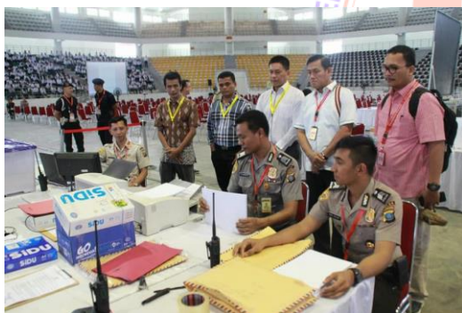
Gambar 7. Proses Pelaksanaan Scanning LJK dihadapan Pengawas Internal dan Eksternal juga Paminal Mabes Polri

Setelah pelaksanaan ujian selesai dengan ditandai jam di layar projector sudah 00.00 dan berhenti maka oleh panitia semua lembar jawaban komputer (LJK) peserta ujian dikumpulkan kemudian dihitung ulang apakah sesuai dengan jumlah peserta dan berikutnya dilakukan proses scanner LJK dihadapan semua peserta, panitia, pengawas dan khususnya Auditor IT untuk memastikan data LJK hasil scanner bersih, tidak ada kecurangan dan semua LJK hasil scanner disimpan di folder yang sudah disiapkan oleh Auditor IT.