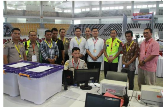
Gambar 2. Panitia dan Pengawas Pelaksanaan Ujian Akademik

Seleksi Penerimaan Anggota POLRI di Kepolisian Daerah Sumatera Utara terdiri Calon siswa Akpol, Bintara dan Tamtama).