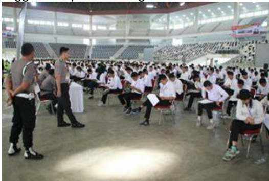
Gambar 6. Proses Pelaksanaan Ujian Akademik menggunakan LJK

tahu waktu pelaksanaan ujian selesai atau tinggal berapa menit lagi.