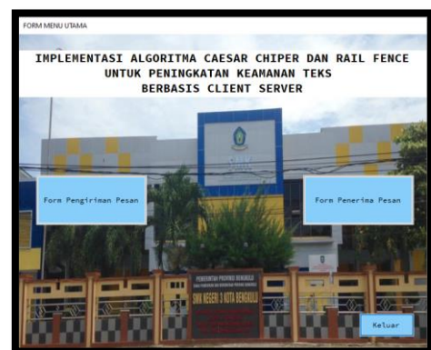
Gambar 4. Menu Utama

Menu Utama merupakan antarmuka aplikasi yang muncul ketika user berhasil melakukan login. Pada menu utama terdapat form yang dapat diakses yaitu form pengiriman pesan dan form penerima pesan. Adapun antarmuka menu utama seperti Gambar 4.