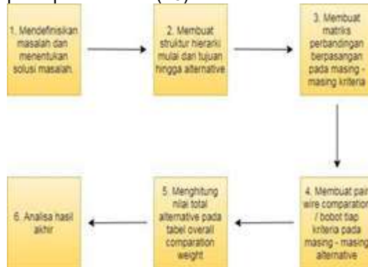
Gambar 1. Tahapan AHP (Analytic Hierarchy Process)

yang memerlukan keputusan yang tepat dan efektif Metode AHP dikembangkan oleh Thomas L. Saaty, professor matematika University of Pittsburg kelahiran Irak. Menurut Thomas L. Saaty, AHP merupakan sebuah hierarki yang dapat memecahkan suatu masalah yang tidak terstruktur dan kompleks dengan model penginputan utamanya adalah menggunakan persepsi manusia (16).