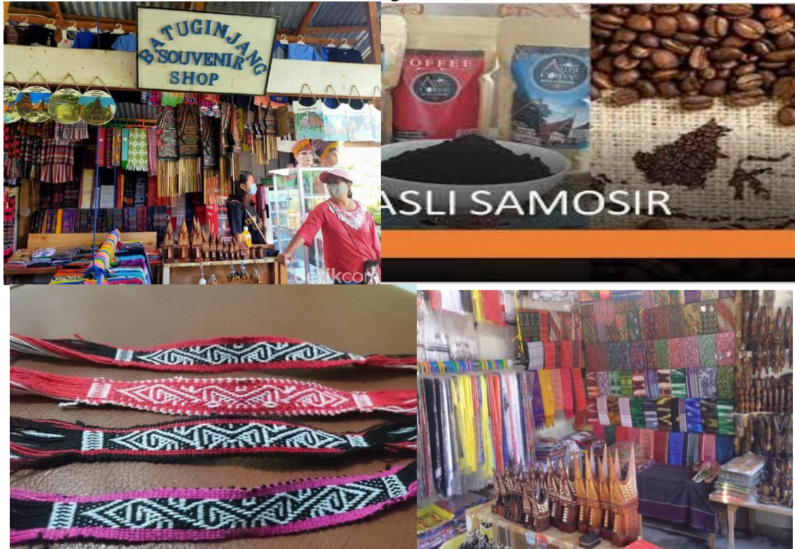
Gambar 1. Hasil Potensi kerajinan tangan

Pengembangan Kabupaten Samosir sebagai salah satu tujuan wisata, sebagaimana yang ditetapkan dalam Peraturan Daerah (Perda) Kab Samosir No. 4 tahun 2011 mengenai Rencana Pembangunan Jangka Menengah Daerah (RPJMD) 2011-2015 dengan visi “Samosir Menjadi Daerah dan Tujuan Wisata Lingkungan Yang Inovatif Tahun 2015” harus dikelola dengan cara terintegrasi oleh seluruh stakeholder. Sebagai daerah kawasan wisata Kab Samosir membutuhkan dukungan dari semua sektor pariwisata salah satunya adalah sektor usaha Industri Kecil dan Menengah (IM).