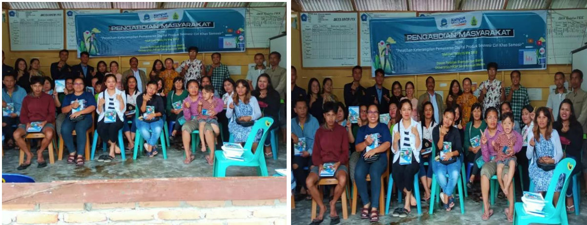
Gambar 5. Berpose dengan peserta pelatihan setelah selesai sosialisasi