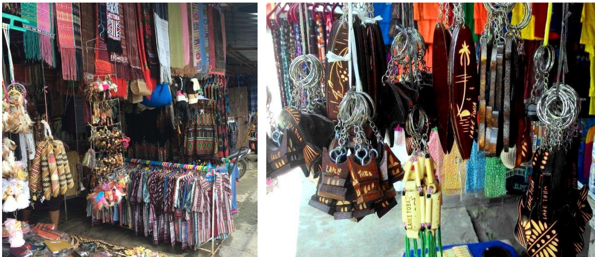
Gambar 3. Hasil Karya kerajinan warga Desa Pindaraya Siallagan, Kec. Siallagan, Kab. Samosir

Sebagai informasi, setiap pengguna baru yang memiliki akun Facebook bisnis dan pribadi wajib ikuti peraturan Facebook yang berlaku. Beberapa cara membuat akun Facebook bisnis dan pribadi bisa dilakukan dengan mudah dan praktis.