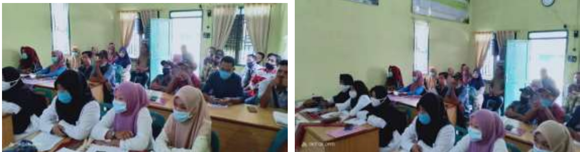
Gambar 3. Perangkat Desa Peserta Pelatihan

Peserta perangkat desa yang mengikuti pelatihan pada pengabdian masyarakat