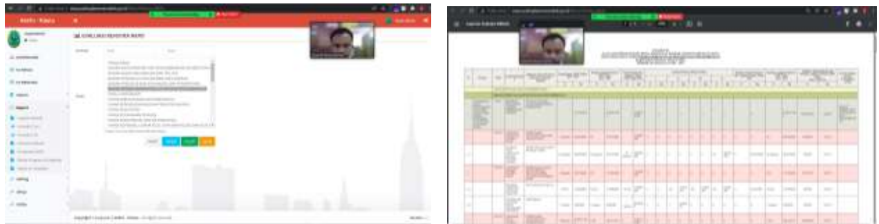
Gambar 2. Praktek penggunaan Aplikasi SEPP oleh operator perangkat daerah

Peserta pelatihan pengguna aplikasi SEPP oleh operator perangkat daerah kabupaten padang lawas utara pada hari kedua terlihat seperti pada gambar 3.