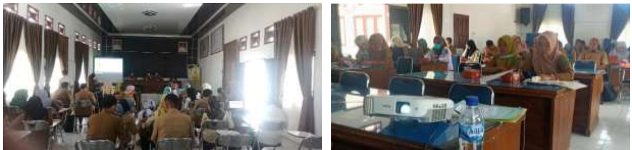
Gambar 3. Operator perangkat daerah peserta pelatihan

Peserta pelatihan pengguna aplikasi SEPP oleh operator perangkat daerah kabupaten padang lawas utara pada hari kedua terlihat seperti pada gambar 3.