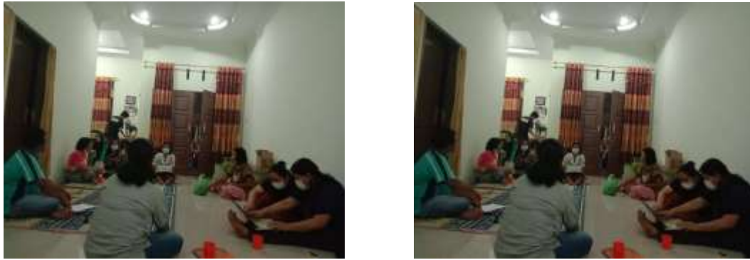
Gambar 1: Pelaksanaan Pengabdian