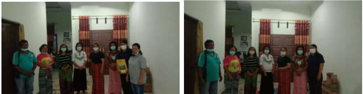
Gambar 2. Peserta Pengabdian