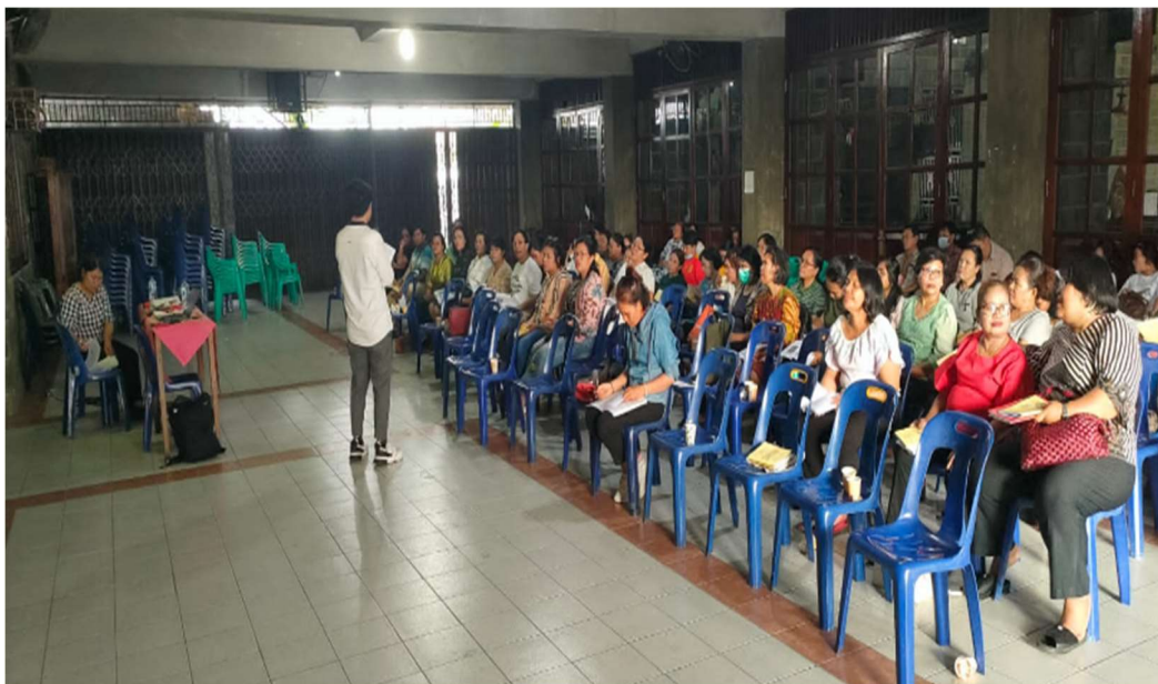
Gambar 3. Peserta dan Aktivitas Penyuluhan