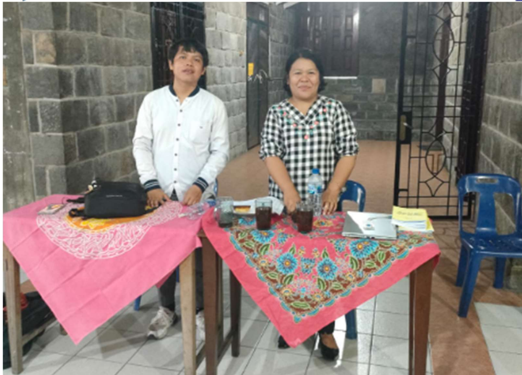
Gambar 2. Peserta Tim Penyuluhan