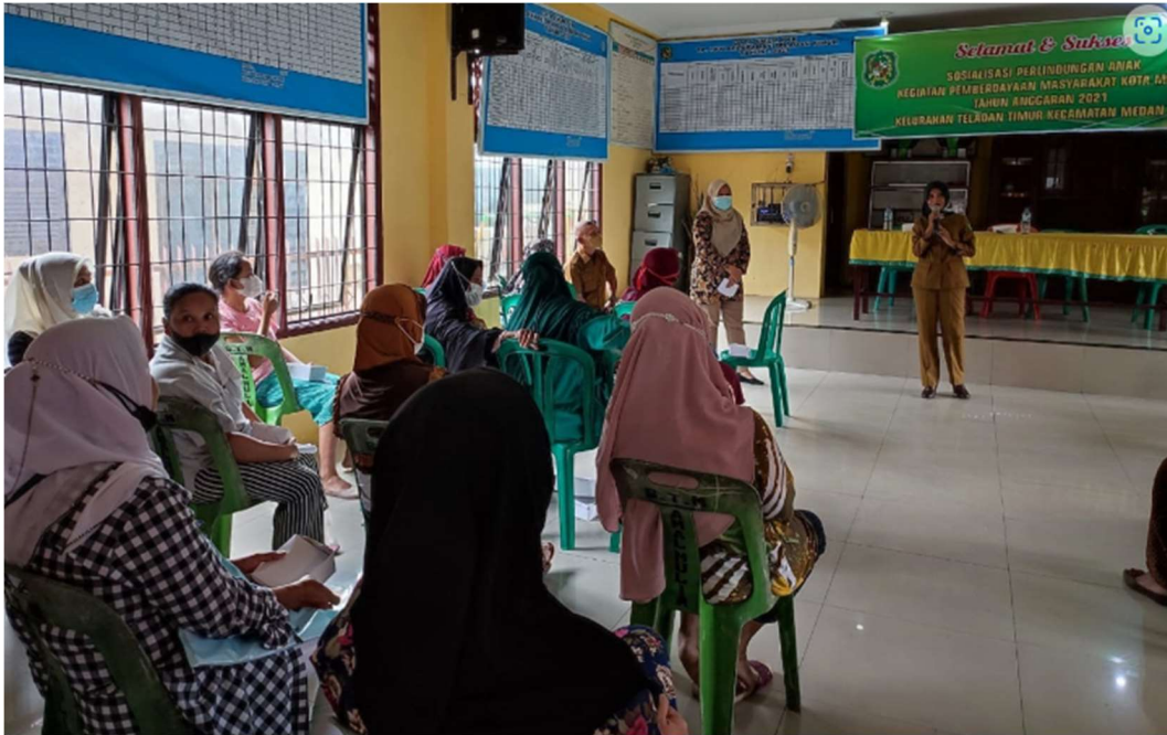
Gambar 5. Pelaksanaan Pengabdian Masyarakat