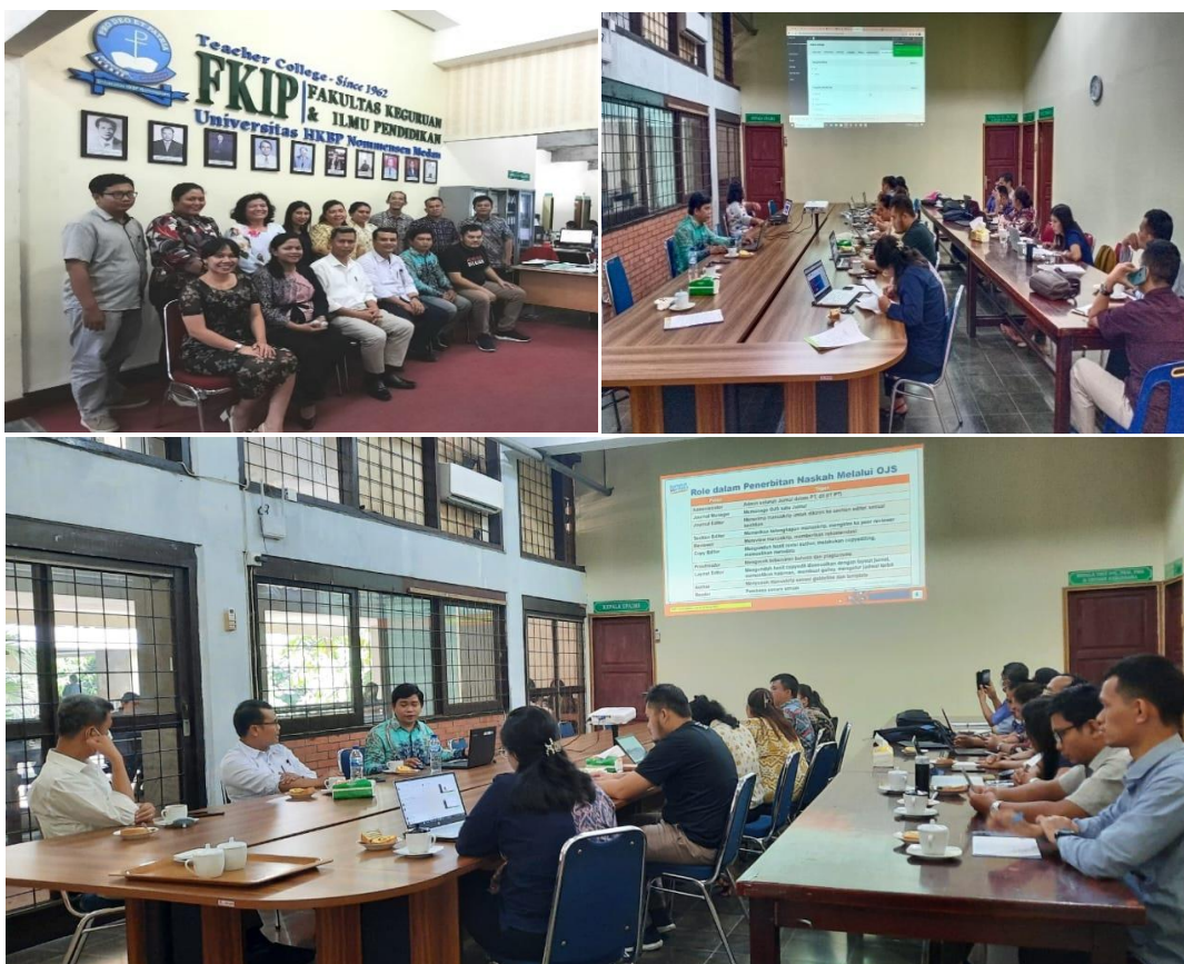
Gambar 2. Diskusi dan Praktek Tata Kelola OJS

evaluasi yang dilakukan setelah pelatihan, sebagian besar peserta menyatakan bahwa mereka merasa lebih percaya diri dalam menggunakan OJS setelah mengikuti pelatihan ini.