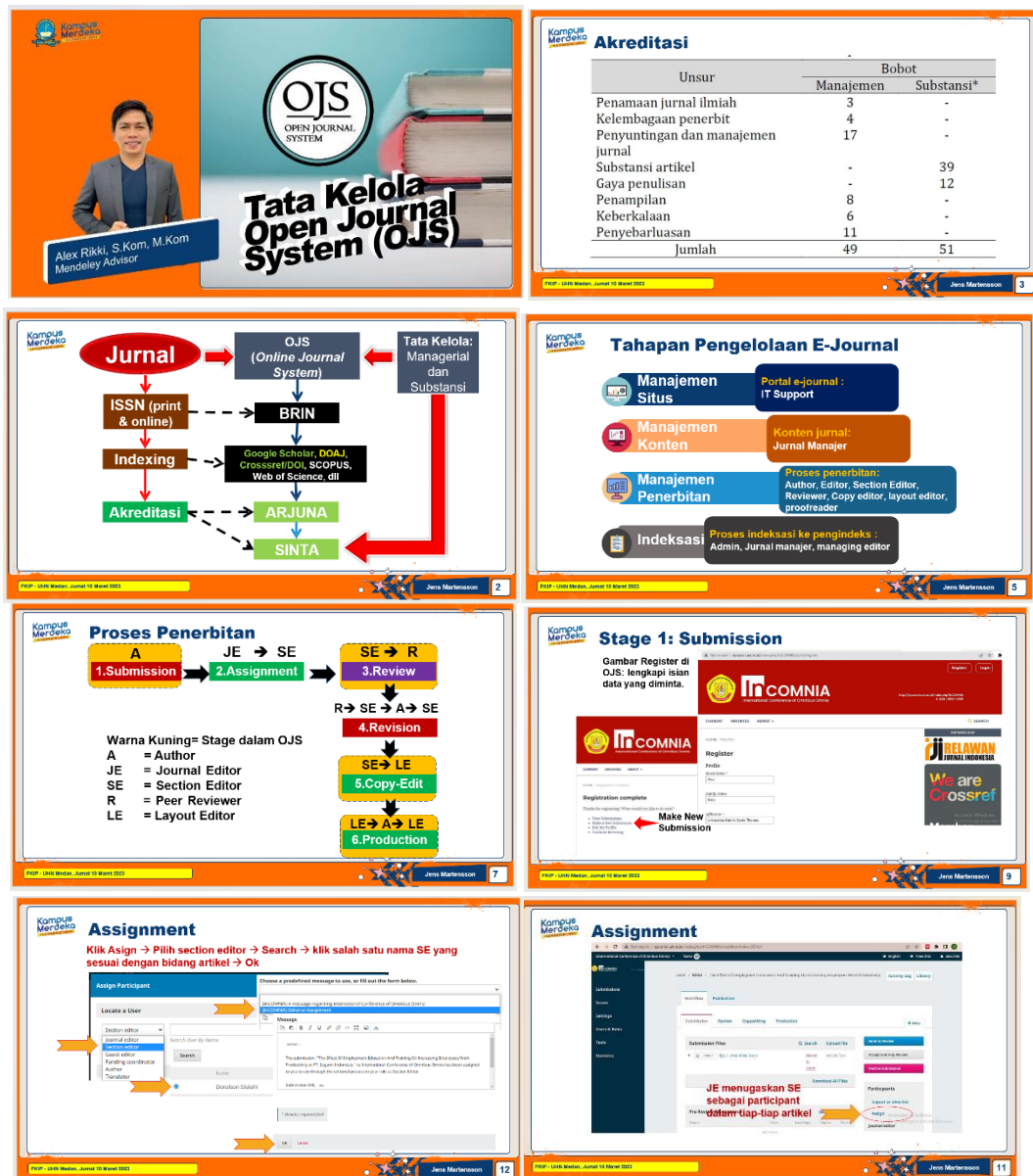
Gambar 1. Materi Pendampingan Tata Kelola OJS

Metode pelaksanaan pelatihan meliputi penyampaian materi oleh narasumber ahli, sesi tanya jawab, serta praktik langsung oleh peserta dalam menggunakan OJS. Selain itu, disediakan juga bahan-bahan pendukung dan sumber daya online yang dapat diakses peserta setelah pelatihan selesai. Materi yang disampaikan pada saat pelaksanaan sebagai berikut :