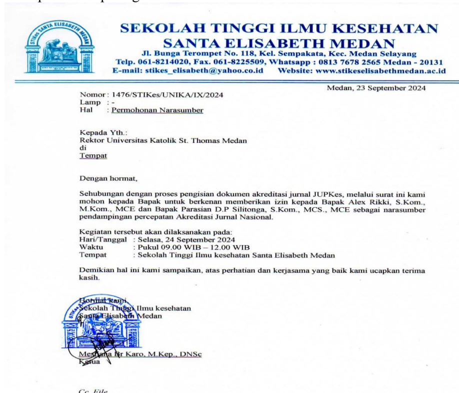
Gambar 2. Surat permohonan narasumber

Permintaan narasumber dalam pelaksanaan pendampingan tatakelola dilengkapi dengan surat permohonan dari Ketua STIKes Santa Elisabeth Medan yang ditujukan kepada Rektor Universitas Katolik Santo Thomas dapat dilihat pada gambar 2 di bawah ini: