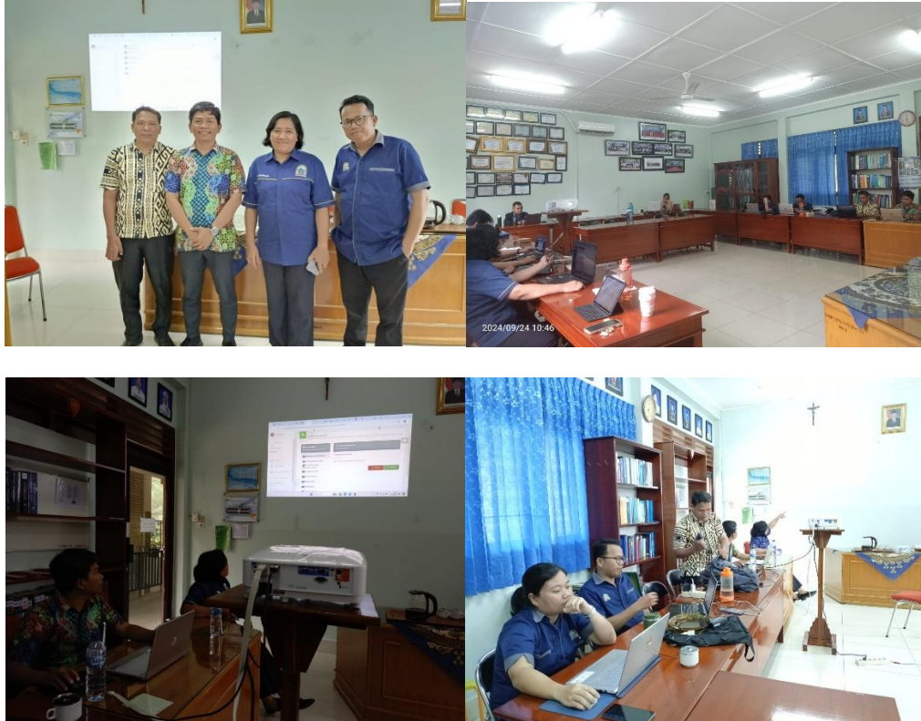
Gambar 3. Narasumber menjelaskan materi Tata Kelola dan borang akreditasi jurnal

Hasil dari kegiatan yang dilakukan dapat dilihat pada gambar di bawah ini: