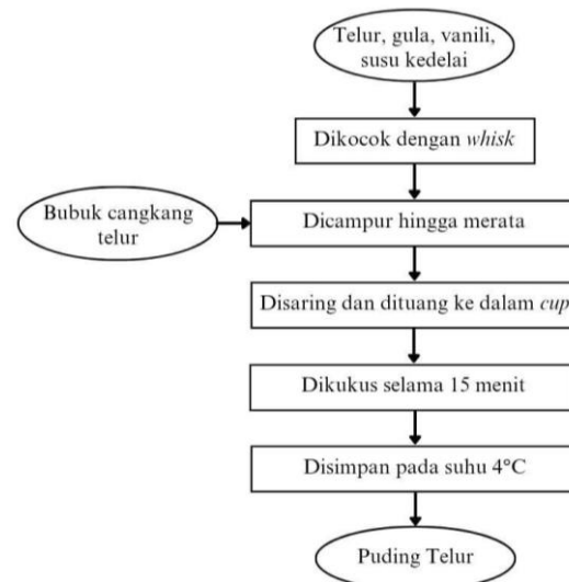
Gambar 1. Proses pembuatan bubuk cangkang telur

dihaluskan menggunakan blender, diayak dengan ayakan berukuran 100 mesh, dan disimpan dalam wadah kedap udara.