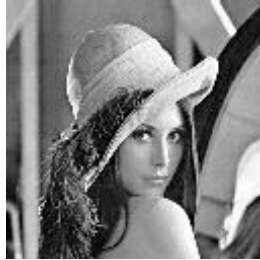
Gambar 1 Citra lena.bmp

Semua tabel dan gambar yang anda masukkan dalam dokumen harus disesuaikan dengan urutan 1 kolom atau ukuran penuh satu kertas, agar memudahkan bagi reviewer untuk mencermati makna gambar.